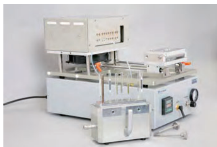
コンテナ部を取り外すことも可能